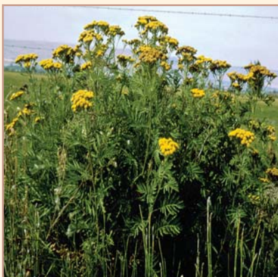
Geedka tansy ee caadiga ah waxaa inta badan lagu qaldaa geedka tansy ragwort, gaar ahaan ka baxa hareeraha waddooyinka.