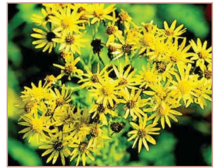
Ubaxa u eg ka daisy loo yaqaan oo kale waxaa laga helaa geedka tansy ragwort, sida caadiga ahna wuxuu leeyahay 13 qaybood oo ubaxyo ah.

Waxaad raacdaa dhammaan sharciyada loogu talagalay marka kiimikada loo isticmaalayo goobaha xasaasiga iyo meelaha u dhow. Mararka qaarkood, waxaa loo baahnaan doonaa in la haysto ogolaansho ama ruqsad gaar ah. Geedaha ha jarin ka hor ama ka dib marka la buufiyo si kiimikada qorshaysan ee wax lagu buufinayaa ay saameyn u yeelato. Xoolaha ka fogee geedaha la buufiyay ilaa muddo 1-2 toddobaad ah ama sida ay dhigayso astaamaha la qoray, hadba kii wakhtigeedu dheer yahay. Kala xiriir Barnaamijka Xakamaynta Cawska Sunta ah ee Degaanka King wixii la xiriira talooyinka goob gaar ah iyo kiimiko wax lagu buufiyo.