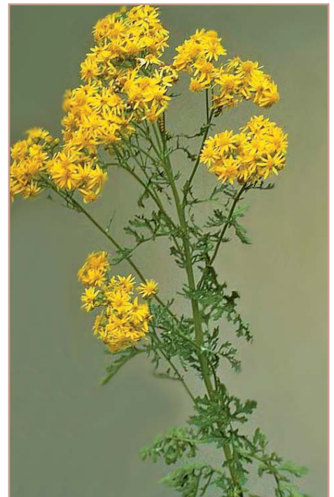
Calaamadaha lagu garto: jirido caleen leh, oo ubax soo bixiya; sida caadiga wuxuu dhererkoodu gaaraa 2-4 feet; iyagoo leh ubax jaalle, oo u eg ka daisy loo yaqaan oo kale.

Naga caawi in aan joojino faafidda cawskan khatarta ah. Hantidaada iyo meelaha jidadka u dhow ka fiiri geedaha ubaxa bixinaya. Joojinta soo bixida iniinta iyo baabi'inta geedaha hada jira, waxaan geedkan sunta ka dhigi karnaa in aanu dhibaato u geysan xayawaanka. La xiriir Barnaamijka Xakamaynta Cawska Sunta ah haddii aad geedka tansy ragwort ku aragto jidadka ama hanti kuu dhow, gaar ahaan meelaha ay fardaha iyo xayawaanka kale daaqayaan.