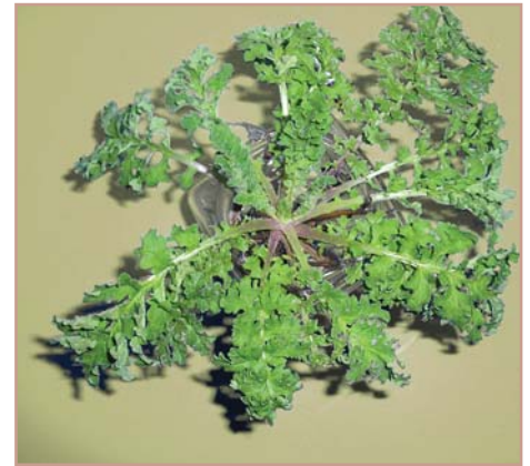
Geedaha yaryar ee tansy ragwort waxay leeyihiin caleemo hoose oo wareegsan oo aan habaysnayn.