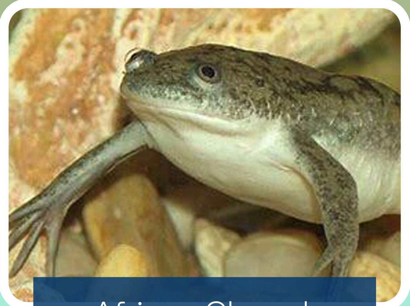
African Clawed Frog