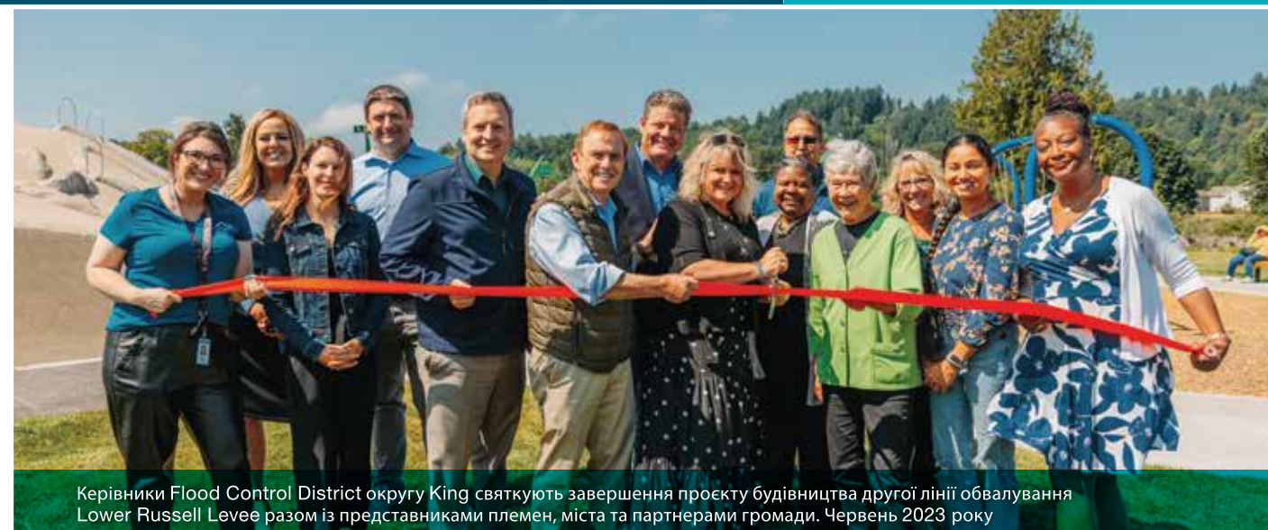
Керівники Flood Control District округу King святкують завершення проекту будівництва другої лінії обвалування Lower Russell Levee разом із представниками племен, міста та партнерами громади. Червень 2023 року