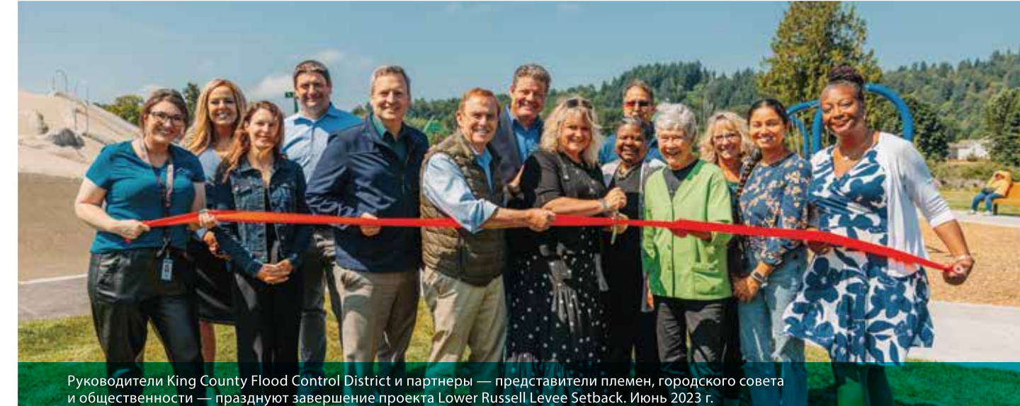
Руководители King County Flood Control District и партнеры — представители племен, городского совета и общественности — празднуют завершение проекта Lower Russell Levee Setback. Июль 2023 г.