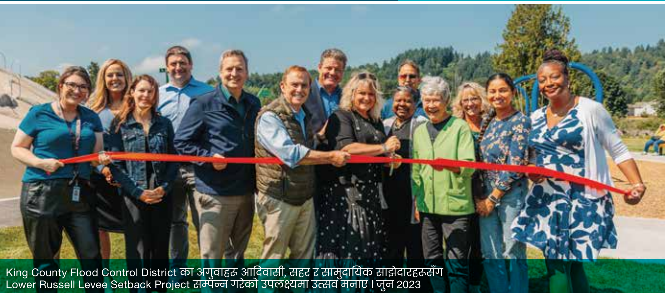
King County Flood Control District का अन्वेषक आदिवासी, सहर र सामुदायिक साझेदारहरूसँग Lower Russell Levee Setback Project सम्पन्न गरेको उपलक्ष्यमा उत्सव मनाए। जून 2023