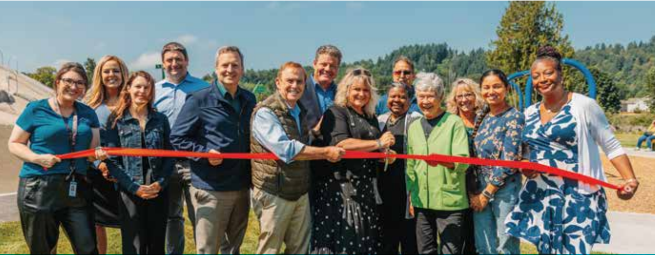
किंग काउंटी बाढ़ नियंत्रण जिले के नेता, अपने नजवातीय, शहरी और सामुदायिक साझेदारों के साथ लोअर रसेल लेवी सेटबैक प्रोजेक्ट (Lower Russell Levee Setback Project) के पूरा होने का जश्न मनाते हैं। जून 2023